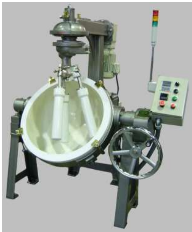
▲第6R号 A型(磁器鉢・磁器杵)

※写真はオプション付(インバータ、デジタルタイマー、パライト、防塵磁器杵、ステンレスコート塗装)