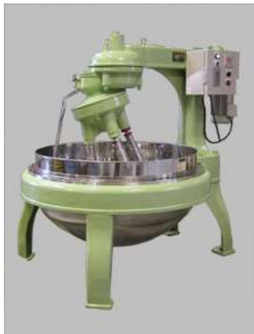
▲第6号 C型(FR式・ステンレス鉢)

作業時間の短縮や、省力化などにもつながると、数多くのお客様にご好評頂いております。