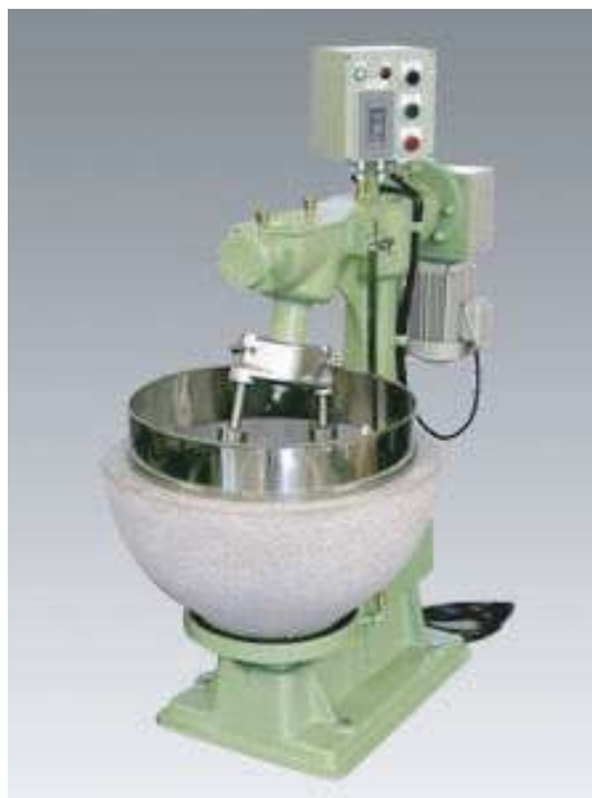
▲そば第2号仕様機(花崗石臼鉢・木杵)

ISHIKAWAの攪拌搗潰機は、「攪拌」「搗り潰し」「混合」「練り合せ」を同時に行うことが出来る、世界で唯一の機械です。 独自の基本構造で、密度の高い粒径均一性、混合均一性を実現し、製品の品質向上に貢献します。 作業時間の短縮や、省力化などにもつながると、数多くのお客様にご好評頂いております。