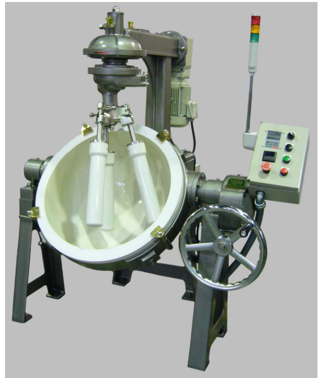
▲第6R号 A型(磁器鉢・磁器杵)

※写真はオプション付(インバータ、デジタルタイマー、パライト、防塵磁器杵、ステンレスコート塗装)