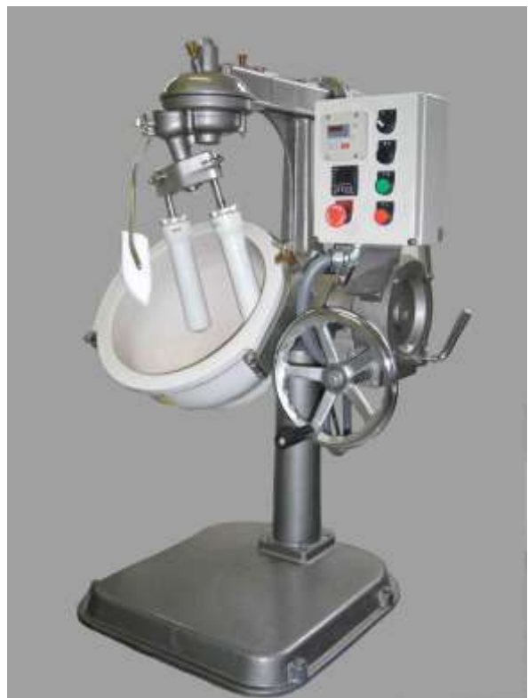
▲第24R号（磁器鉢・磁器杵）

※写真はオプション付（インバータ、デジタルタイマー、防塵磁器杵、テフロンかき板、ステンレスコート塗装）