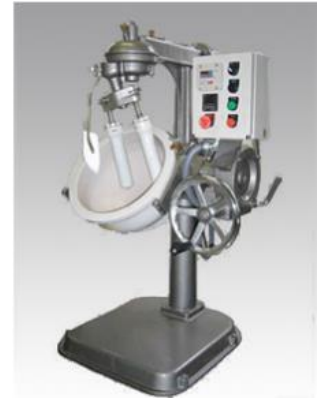
24R号外観 (オプション付き写真)