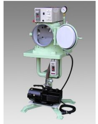
16ZD外観 (オプション付き写真)