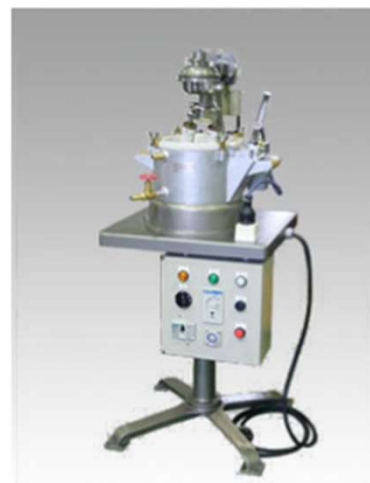
18EB号外観 (オプション付き写真)