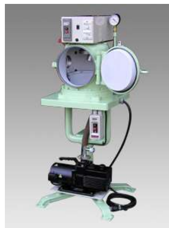
16ZD外観 (オプション付き写真)