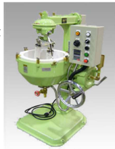
24R号外觀 (オプション付き写真)