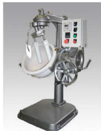
24R号外観 (オプション付き写真)