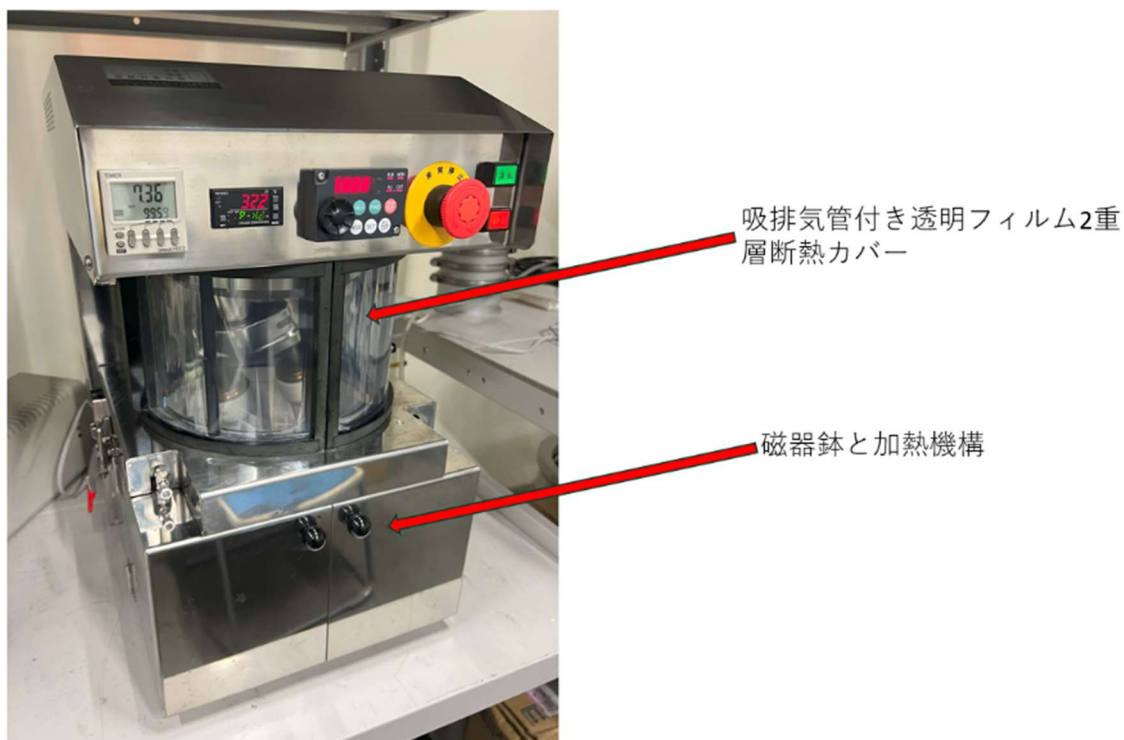
図 1. D18SEB 装置全体写真