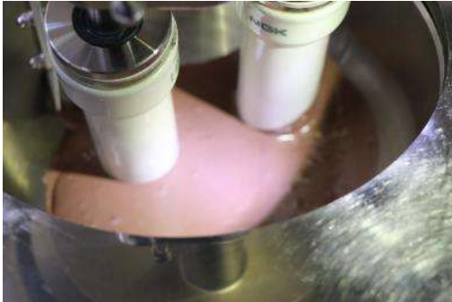
図 6. 初期のスラリー状態