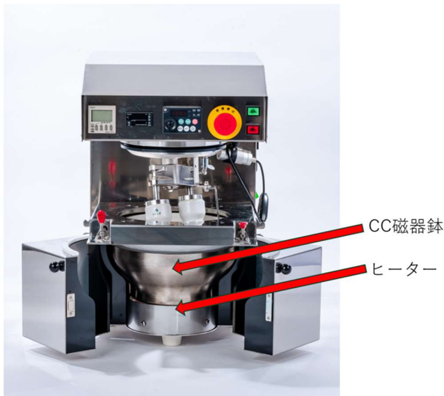
図 2. D18SEB のヒーターと CC 磁器鉢写真

CC 磁器鉢とは、一般的な磁器鉢の外側に弊社で開発した熱伝導接着剤を介して、銅鉢で覆われた磁器鉢である。磁器鉢は熱容量が大きく、鉢底のみを加熱すると鉢底のみが温度上昇して、側面などはなかなか昇温しない。そのため、鉢底のみが膨張し、最悪の場合には割れてしまうこともある。その懸念を解消するために、磁器鉢全体を銅鉢で覆い、鉢底のみを加熱しても銅鉢が先に温まり、外側全体から均一に磁器鉢を昇温することができるようにしたのが CC 磁器鉢である。D18SEB のヒーターの温度特性は図 4 に示す。