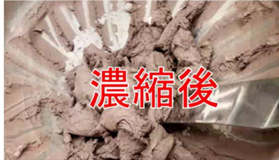
図 7. 実験開始 30 分後のスラリー状態