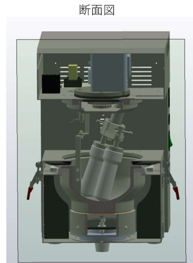
図 3. D18SEB の断面図