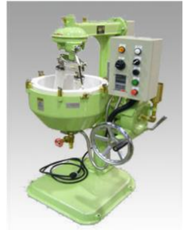
24R号外観 (オプション付き写真)